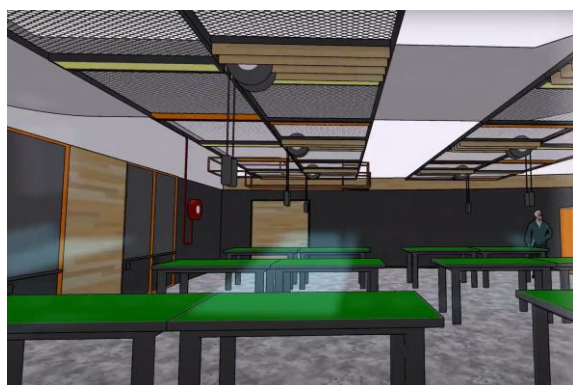
位於地庫的創科實驗室