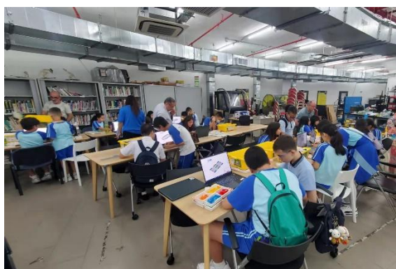
位於地庫的機械工房