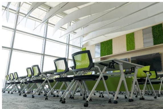
位於大堂的多功能空間