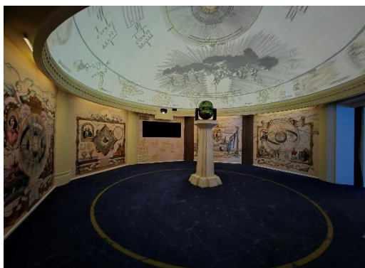
G01 天文科學展廳“觀星者”