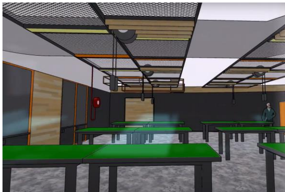
位於地庫的創科實驗室