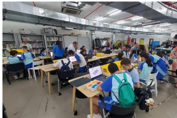
位於地庫的機械工房